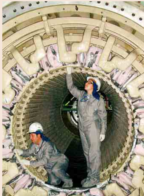
Dos operarios trabajan en la recarga de la turbina de la central de Garoña.

Aunque parecía que tenía los días contados, todavía no está todo dicho sobre el futuro de la central nuclear de Garoña (Burgos). El Ministerio de Industria negocia con Iberdrola y Endesa (dueños de Nuclenor, empresa que explota la planta), prolongar la vida de Garoña más allá de 2019. Las eléctricas han abierto un diálogo con Industria al máximo nivel para salvar la nuclear burgalesa. Esta negociación coincide con el rechazo del sector a las nuevas tasas impuestas por el Gobierno y la incertidumbre sobre el papel de la energía atómica en el mix energético. La Sociedad Nuclear Española ha reclamado un “marco estable y predecible” para un sector que genera 30.000 puestos de trabajo. Francisco Rahola, socio de Energía de Ernst&Young, señala que “sería aconsejable realizar un análisis a largo plazo de los beneficios e inconvenientes de ampliar el parque nuclear español”. Valentín de Miguel, de Accenture, precisa que “la pregunta a día de hoy no es tanto si debería haber más centrales, sino la idoneidad de alargar la vida útil de las actuales”. El ministro de Industria, José Manuel Soria, ha vuelto a dejar claro esta semana que no piensa renunciar a ninguna fuente. Soria defendió “alargar la vida de las centrales nucleares que cumplan con todos los requisitos de seguridad”.