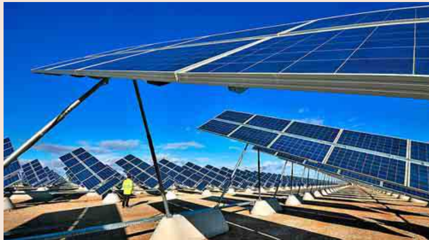
Parque solar fotovoltaico de Zuera, en la provincia de Zaragoza, desarrollado por Elecnor.