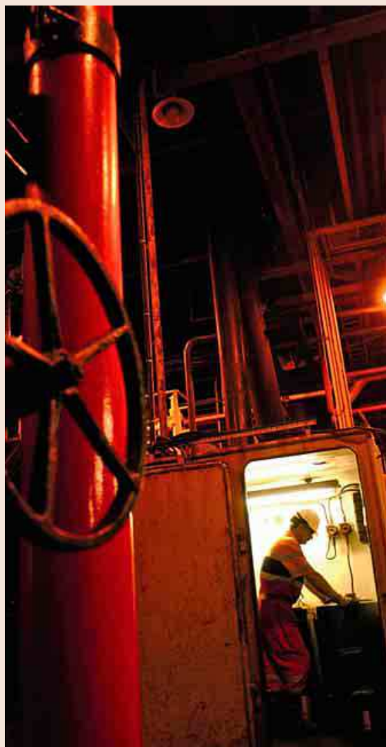
Plataforma petrolera Casablanca de Repsol, frente a la costa de Tarragona.