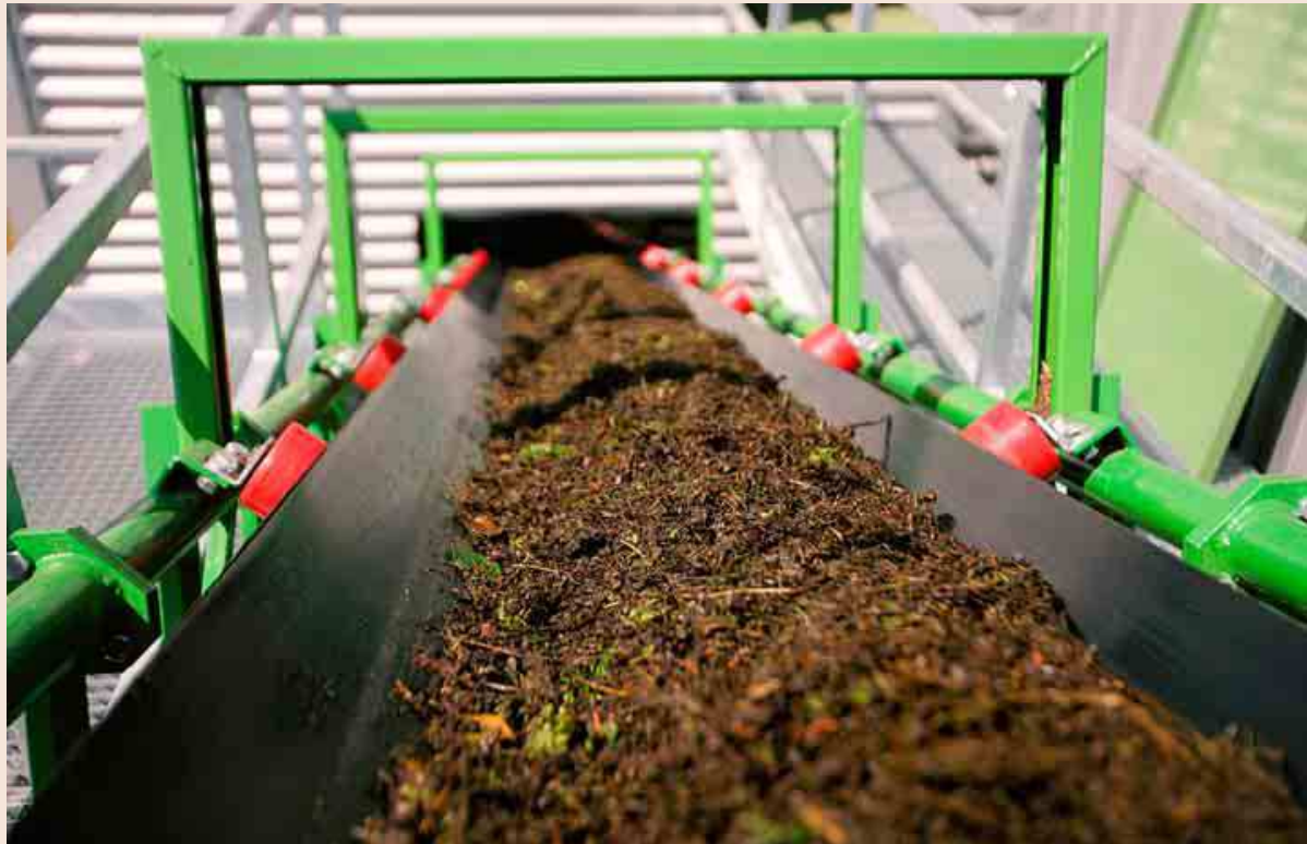
Planta de biogás del grupo Axpo. La división ibérica de esta compañía facturó 614,5 millones de euros el pasado ejercicio.