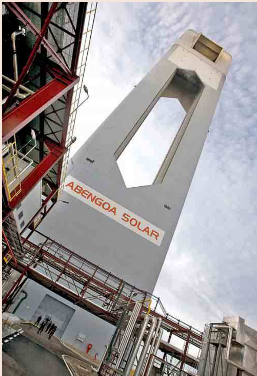
Vista de la planta de energía termosolar que Abengoa posee en Sanlúcar La Mayor (Sevilla).