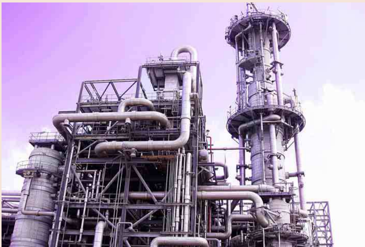
Vista de la planta de licuefacción de Damietta, en Egipto, que pertenece a la compañía española Unión Fenosa Gas (UFG).

GAS Las compañías reivindican el papel que puede jugar la Península Ibérica como vía de tránsito de este elemento hacia Europa. La demanda alcanza un récord histórico pese a la caída en ciclos combinados.