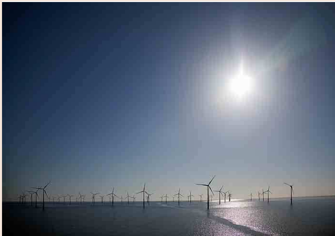
Parque eólico marino de Vestas Eólica en Irlanda. La firma de origen danés está especializada en la fabricación, instalación y venta de aerogeneradores.

un mercado mayorista, sino que su razón de ser es "atender la demanda térmica y el servicio de la industria". Acogen alerta de que las nuevas tasas aplicadas por el Gobierno ponen en peligro la supervivencia del 30% de las cogeneraciones industriales. Una firma con novedades en el horizonte es Xpo. La empresa de origen suizo, que gestiona con 2.800 megavatios en España generados en plantas de cogeneración, eólicas, hidráulicas, termosolares, fotovoltaicas y de biomasa, acaba de inaugurar un nuevo centro de control y operación de generación eléctrica para potenciar su negocio en España.